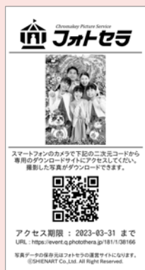
レシートプリント