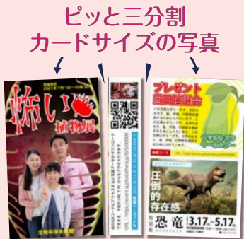
フォトプリント (カード)