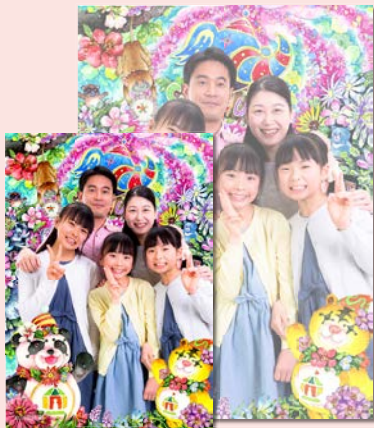
フォトプリント (L判/2L)