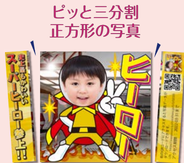
フォトプリント (スクエア)